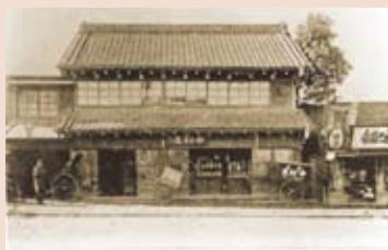
明治42年に新宿の現在地に移転した中村屋

本展では、中村屋サロンの芸術家、文化人たちと、作品にまつわるドラマをご紹介します。