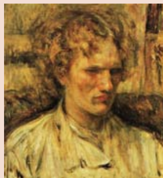
中村彝「エロシェンコ氏の像」(重要文化財) (東京国立近代美術館蔵)