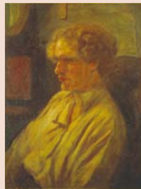
鶴田吾郎『盲目のエロシェンコ』 (中村屋蔵)