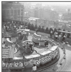
▲伊勢丹遊園地（昭和38年）