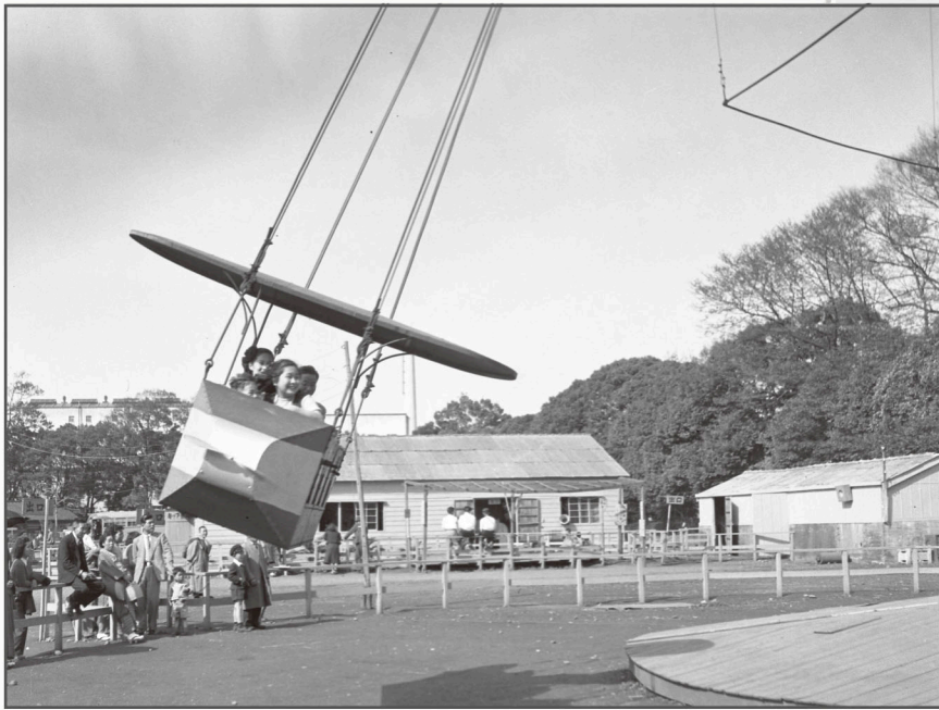
▲新宿御苑遊園地（昭和27年）

新宿歴史博物館では、データベース「写真で見る新宿」により当館が所蔵する写真資料を公開し、たくさんの方々に楽しんでいただけるような、取り組みを始めています。