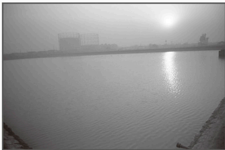
▲淀橋浄水場（昭和37年）