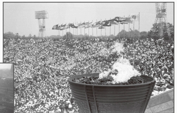
▲第3回アジア競技大会（昭和33年）

今回の所蔵資料展では、高度成長期の昭和30年代を中心に新宿を舞台に様々な当時の記憶を映し出す写真や地図などを展示します。