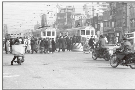
▲都電 新宿駅前（昭和45年以前）