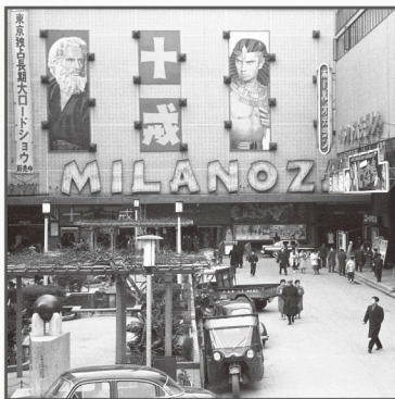
▲新宿ミラノ座（昭和33年頃）