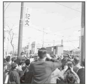
▲皇太子御婚礼パレード（昭和34年）