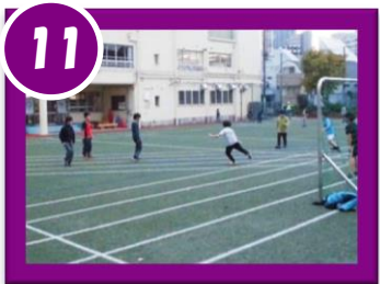
みんな大好きサッカー♪