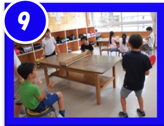
たっきゅうが大人気!