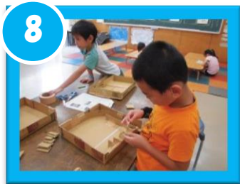
コリントゲームづくり