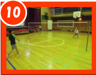
バドミントンきょうしつ