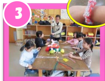
ミサンガきょうしつ