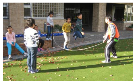
校庭遊びでは12月の長なわ大会に向けて練習する姿も見られるようになりました。