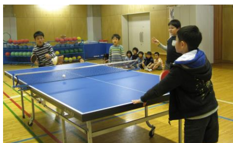
卓球大会は2年生から5年生までが参加。試合も応援も盛り上がりました。