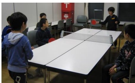
大会が終わった後も卓球の人気が続ぎ、ひろばのテーブルを使ってよく遊んでいます。