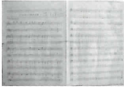
四谷第三小学校校歌原譜 (四谷小学校蔵)

本展は新宿区立小学校との協働企画展として開催し、区立小学校全29校の所蔵資料や写真を初めて一堂にご紹介いたします。思わず懐かしいと感じるものや、意外なものがその学校にまつわる歴史をものがたります。是非ご家族でご覧ください。