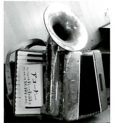
アコーナー(大久保小学校蔵)