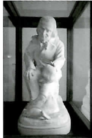
ベスタロッツ像(江戸川小学校蔵)