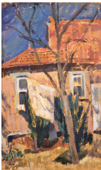
《落合のアトリエ》1916年 横須賀美術館蔵