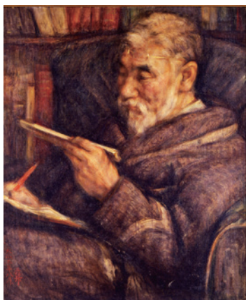
《田中館博士の肖像》1916年 東京国立近代美術館蔵