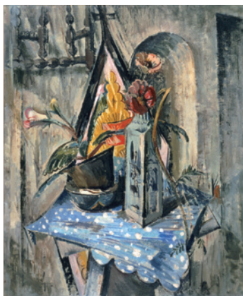
《カルピスの包み紙のある静物》1923年 茨城県近代美術館蔵