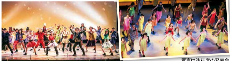
写真は昨年度の発表会