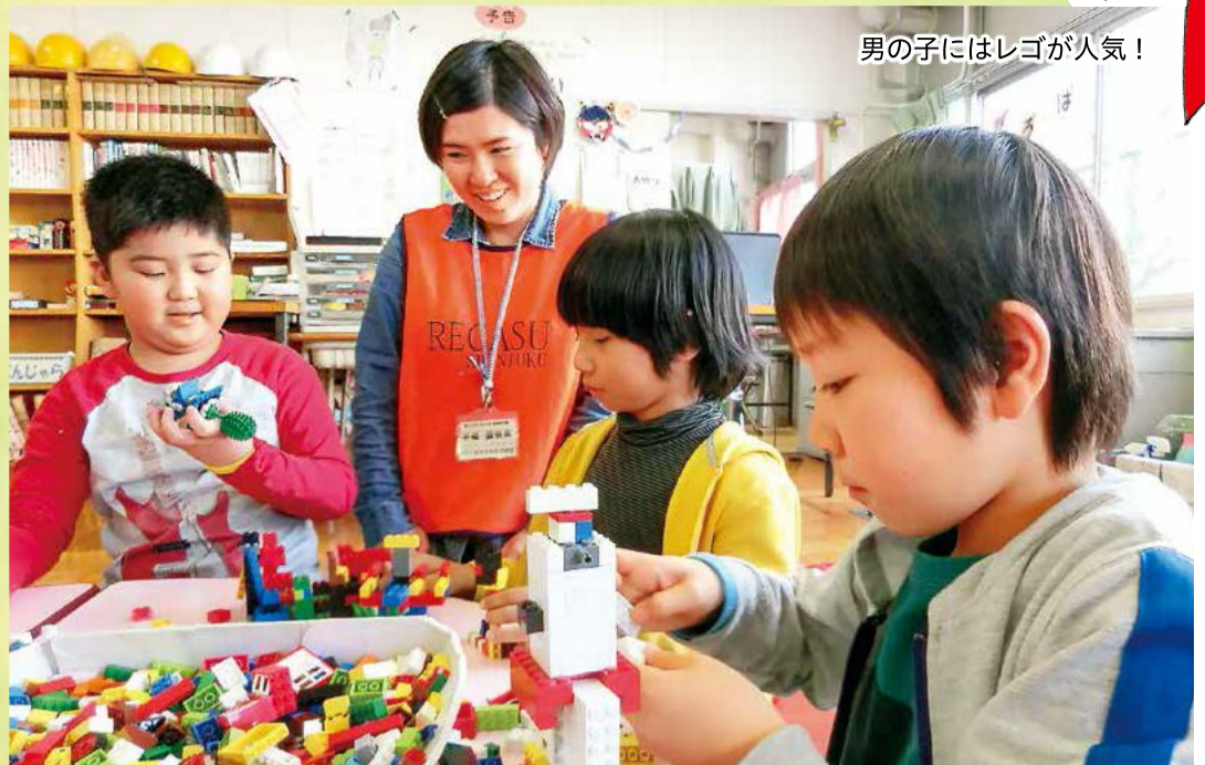
男の子にはレゴが人気!