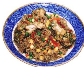
アロス・コン・ポーヨ