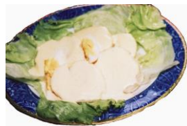
パパ・アラ・ワンカイーナ

「ペルー料理体験」は、ペルーの家庭料理 パパ・アラ・ワンカイーナ (じゃがいもの唐辛子チーズソースかけ)等に挑戦します！