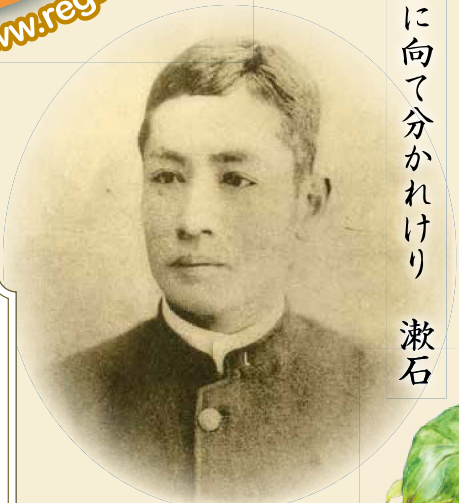
帝大の制服姿の漱石 明治25年(1892)