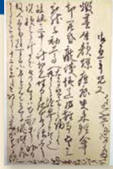
漱石 子規あて葉書 明治24年(1891)7月24日 新宿歴史博物館寄託

ともに生誕一五〇年を迎える夏目漱石(一八六七〜一九一六)と正岡子規(一八六七〜一九〇二)。二人は学生時代に共通の趣味である寄席を通じて東京で出会い、漢詩文の回覧や書簡のやりとりを重ねることで互いの才能を認め、強い友情で結ばれました。本展ではその出会いから、子規の故郷である愛媛県松山市での五十二日間の共同生活、子規の死による別離に至るまでの二人の交友に焦点を当て、東京・松山に残る二人の記憶や足跡を、遺された原稿、書簡、遺愛品などの様々な資料を通じて辿ります。