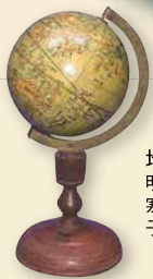
地球儀(子規遺愛品) 明治34年(1901) 寒川鼠骨より贈られたもの 子規庵保存会蔵