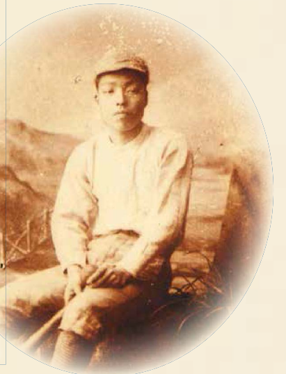
野球のユニフォーム姿の子規 明治23年(1890)