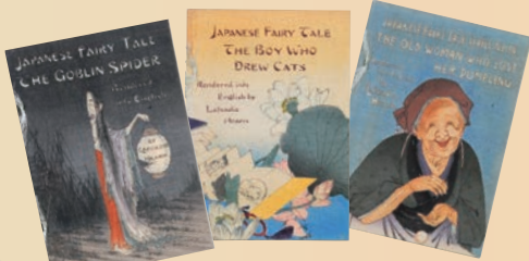
「JAPANESE FAIRY TALE SERIES」(ちりめん本) 小泉八雲

新宿には、小泉八雲や夏目漱石、泉鏡花など、多くの文学者が暮らしていたよ。怖い話も書いているんだ。あらすじを読んで、結末がどうなるのか予想してみよう!