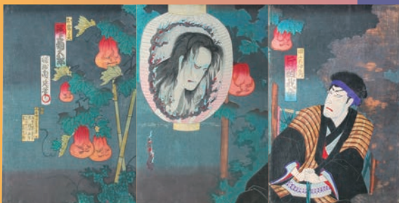
田宮伊右衛門 お岩の霊 「形見草四谷怪談」 明治17年(1884) 楊洲周延

会期中一部展示替えあり 前期：6月30日(土)~7月22日(日) 後期：7月24日(火)~8月26日(日) 時 9:30~17:30(最終入場は17:00) 場 新宿歴史博物館 地下1階企画展示室 休館日 7月9日(月)・23日(月)・8月13日(月) 問 新宿歴史博物館 Tel 03-3359-2131