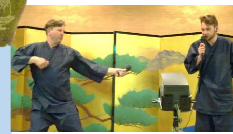
宴会場でカラオケ