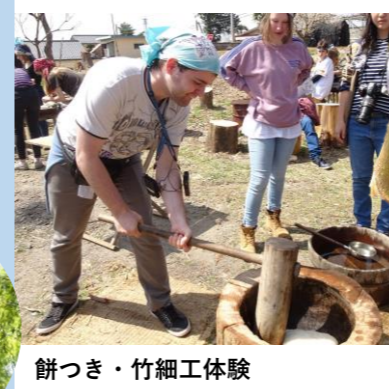
餅つき・竹細工体験