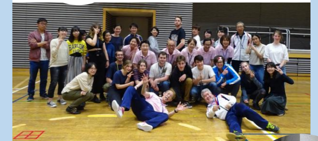
ユニカール・ボッチャ体験