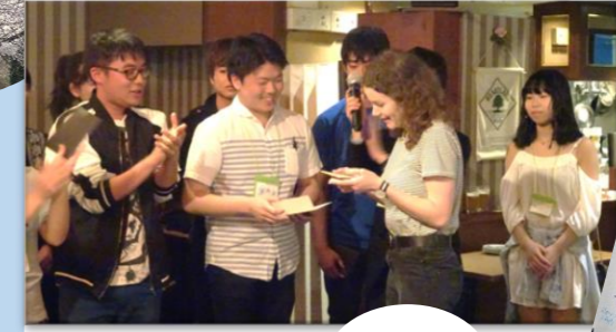
さよならパーティー