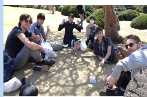
新宿御苑でピクニック