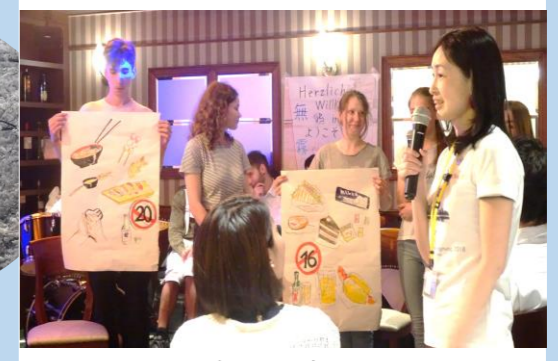
ドイツと日本の違いを発表