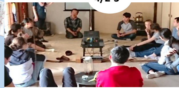
地方のまちづくりについてディスカッション