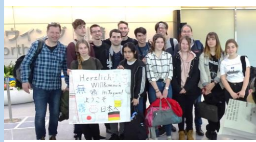
ようこそ東京・新宿へ!