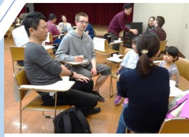
ホストファミリーとの交流会