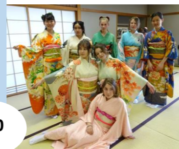
着付け・茶道体験