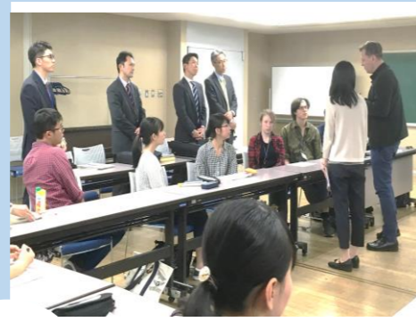
都市計画ディスカッション