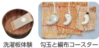
洗濯板体験 勾玉と編布コースター

回 8月11日(土祝) 時 10:00～12:00(受付開始9:40) 場 新宿歴史博物館 正面玄関横 対 小学生以上 定 先着100名 申 当日直接ご来場ください。 その他 ごみ袋(レジ袋大)をお持ちください。