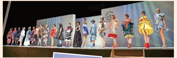
昨年の グランプリ作品