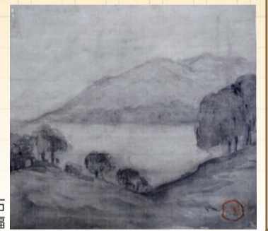
夏目漱石 風景墨画幅