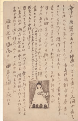
芥川龍之介 松岡譲あてはがき 大正6年(1917)10月25日