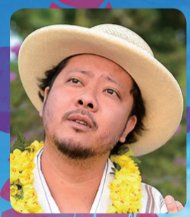
UKULELE GYPSY (キヨサク from MONGOL 800)