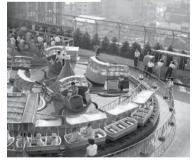
伊勢丹屋上遊園地 昭和38年(1963)頃