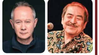
ピーター・バラカン 吾妻光良

¥ 全席指定3,000円 新宿文化センター友の会先行予約 5月25日(土)12:00~ Web 6月1日(土)9:00~