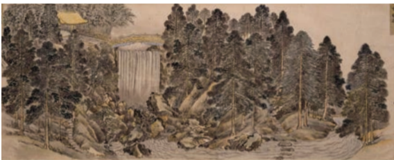
戸山荘図(鳴鳳溪 館蔵)

近年行われた新宿の発掘調査の中から、特に貴重な発見があった遺跡の調査成果を紹介しています。「特集 尾張徳川家戸山屋敷とその周辺」では、御三家筆頭・尾張徳川家の江戸下屋敷庭園「戸山荘」について、11次におよぶ発掘調査により発見された遺構・遺物の紹介のみならず、各種絵図類から復原地図を作製しました。また、戸山ヶ原の昭和初期の懐かしい映像も会場内で上映しています。さらに、区内の発掘では近代の生活用具も出土していますが、その中でも酒屋から顧客に貸し出される「鉄文字徳利」に注目しました。出土した「鉄文字徳利」には、昔の町名、現在も使われている町名、また今も営業している酒屋の名前などが見えます。会場のそばの大きな展示スペースに地図を広げ、酒屋の位置に徳利を置いてみました。「とっくり」とご覧ください。