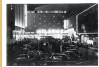
歌舞伎町映画館街 ミラノ座(夜景)昭和33年(1958)頃