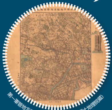
第一軍管地方二万分之一迅速測図原図(国土地理院蔵)

明治初期に日本で初めて近代測量によって作成された手描きの迅速測図(フランス式彩色地図)原本を、国土地理院外で初公開!! ※期間中展示替あり