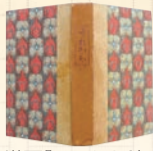
夏目漱石「それから」初版本 明治43年(1910)春陽堂 装丁:橋口五葉

日 10月19日(土)、11月16日(土) 14:00～16:00 受付は13:30～ ¥全1,000円 場 漱石山房記念館 地下1階講座室 締切 10月4日(金) 講 大野淳一(武蔵大学名誉教授) 申 往復はがき に記載例(3面)のとおり記入し、漱石山房記念館へ。 ※はがき1枚につき1名まで。 WEB