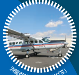
測量用航空機「くにかげ皿」