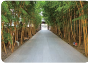
竹林の梅窓院参道