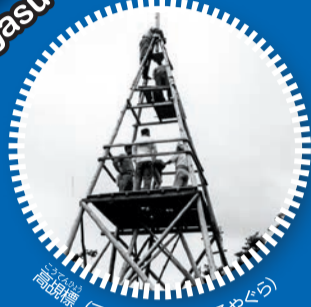
高品質 三角測量に使用するやぐら

ギャラリートーク 展示について、担当学芸員が解説します。 日 会期中毎週土曜日 13:00～13:30 場 新宿歴史博物館 地下1階展示室前集合 (ただし、特別展観覧券または半券が必要)