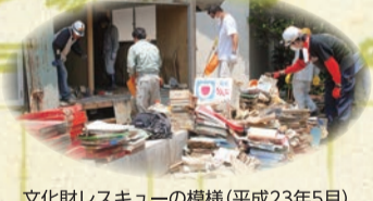
文化財レスキューの模様(平成23年5月)

「江戸家資料」は、江戸時代から米の積出港として栄えた阿武隈川河口の荒浜村の豪商・江戸清吉が収集した、明治から昭和までの小説家・劇作家・詩人・歌人・政治家の原稿・書簡・掛軸・屏風などから構成された個人コレクションです。2万点にも及ぶ資料群は、平成23(2011)年3月11日の東日本大震災に伴う津波により被災しましたが、文化財レスキューの活動により救出されました。資料の一部は科学的な保存処理をされ、現在宮城県亘理町立郷土資料館で保管されています。本展示会は、この「江戸家資料」のなかから、夏目漱石が漱石山房原稿用紙を使用して執筆した作品の中で、現存する最も古い原稿「文鳥」などの貴重な資料と、漱石山房に集った人々の関係資料、そして泉鏡花・田山花袋ら新宿ゆかりの文学者たちの資料を展示します。併せて今なお復興途上にある東北の姿、東日本大震災における文化財レスキューの活動の様子も紹介します。