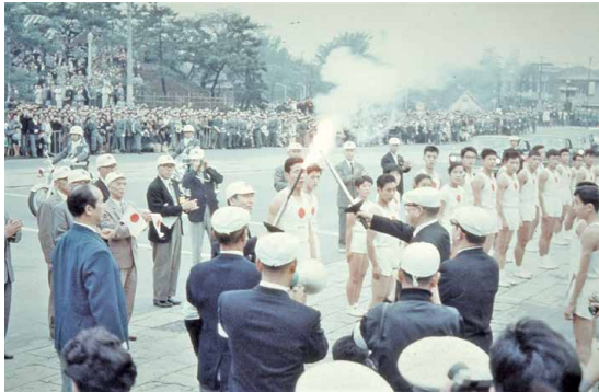
聖火リレー-四谷見附