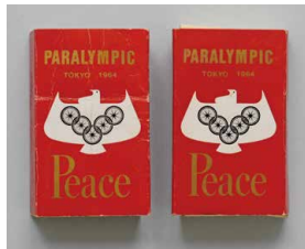
パラリンピック記念ピース箱