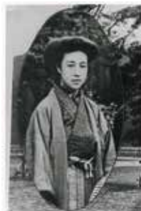
平塚らいてう