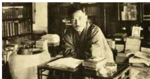
早稲田南町の書齋に於ける漱石 大正3年(1914)12月