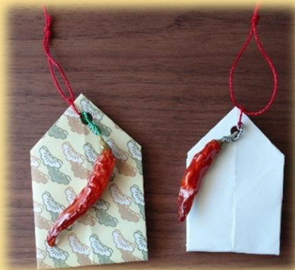
内藤とうがらしお守り（イメージ）