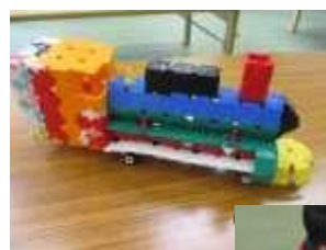
レゴ&ラキュー大会