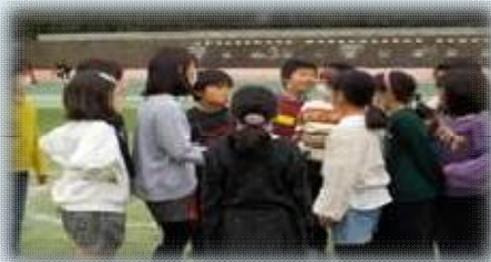
自分たちでリレーの順番決め