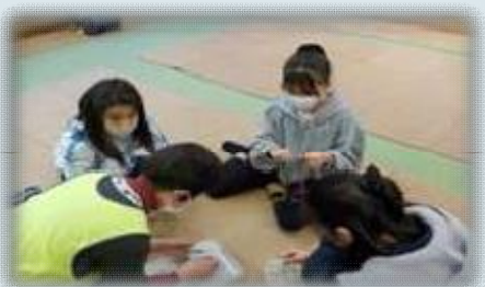
くみひも編みに挑戦