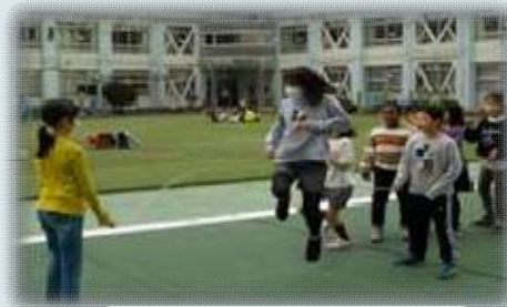
学年をこえて大縄とび