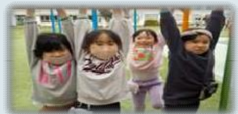
仲良しでうんてい