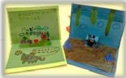
バレンタインカード作り

*ひろばでは入退室の管理は行いません。ご家庭で帰宅時間などの約束をしてご参加ください。