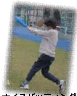
ナイスバッティング！