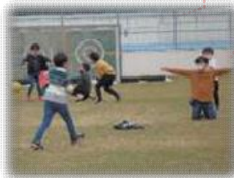
寒くても元気いっぱい♪