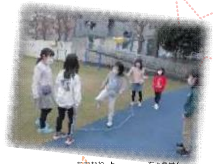
みんなで大縄跳びに挑戦！