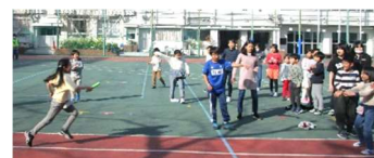
3月、リレー大会、プラバンづくりをしました