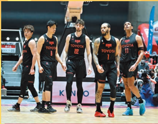
アルバルク東京 ※参加選手未定

プロバスケットボールリーグBリーグに所属し、トップレベルの強さを誇るアルバルク東京の選手とアカデミーコーチによるバスケットボール教室です。ボールを触ったことがない初心者も、バスケがもっとうまくなりたい経験者も、大集合! プロ選手からバスケの魅力を学ぼう!