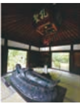
哲学堂公園は こちらから