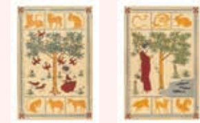
「彼岸過迄・表紙」「彼岸過迄・裏表紙」

¥ 絵はがき 各100円、 トートバッグ(ナチュラル/ネイビー) 各1,000円