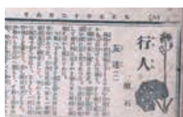
漱石『行人』(部分) [東京朝日新聞] 大正元年(1912)12月6日