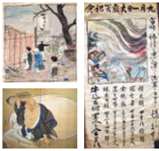
ほてい屋 牛込在郷軍人会 七福神屏風(部分) 大震災記念ポスター