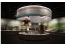
中野区立歴史民俗資料館