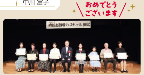
表彰式(10月15日) 区長賞受賞のみなさま