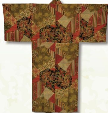
夏目漱石の長襦袢