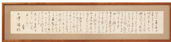
夏目金之助 松根東洋城宛て書簡 明治45年5月30日