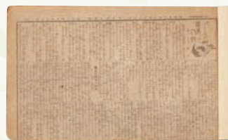
「虞美人草」新聞切抜き