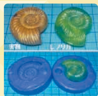
化石のレプリカづくり