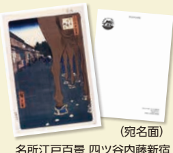
(宛名面) 名所江戸百景 四ツ谷内藤新宿 歌川広重(初代) 安政4年(1857)