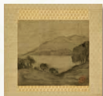
夏目漱石筆 風景墨画