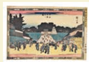
東都名所坂つくしの内 牛込神楽坂之図 歌川広重(初代) 天保11年(1840)頃