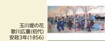
玉川堤の花 歌川広重(初代) 安政3年(1856)