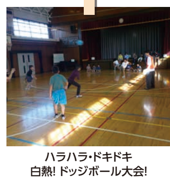
ハラハラ・ドキドキ 白熱! ドッジボール大会!