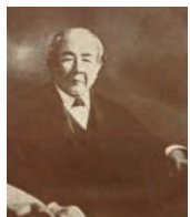
渋沢栄一