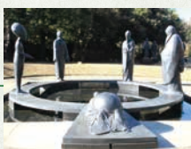
哲学堂公園 哲学の庭