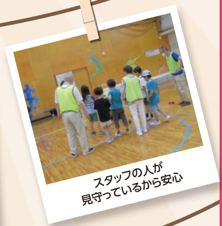
スタッフの人が見守っているから安心