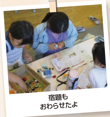
宿題もおわらせたよ