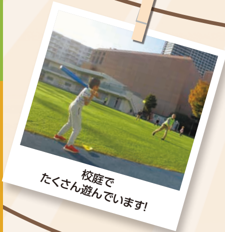
校庭でたくさん遊んでいます!