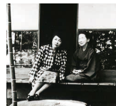
母キツと庭を眺める