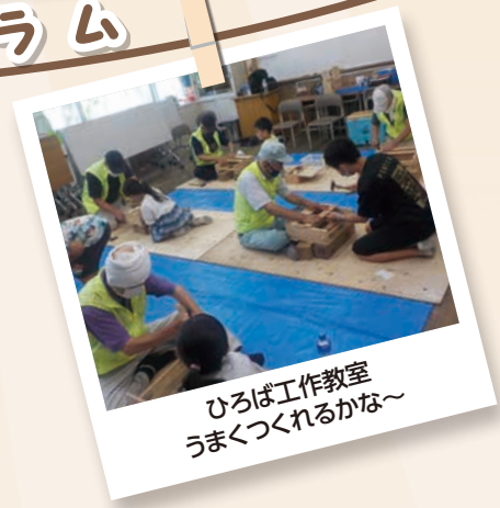
ひろば工作教室 うまくつくれるかな~