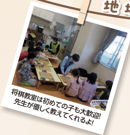
将棋教室は初めての子も大歓迎! 先生が優しく教えてくれるよ!