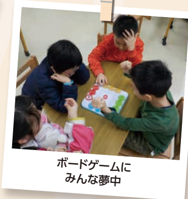
ボードゲームにみんな夢中