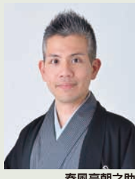
春風亭朝之助 (2024年秋 眞打昇進決定)