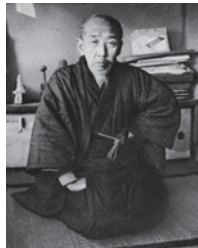
四谷に住んだ民俗学者 山中共古(1850～1928)