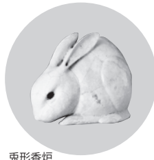
兎形香炉 市谷本村町遺跡出土資料

動物と人とは、太古より社会や自然の中で共生してきました。本展では、さまざまな資料を通じ、動物と人の関わり合いの歴史を紹介します。ぜひご家族で、夏休みにお出かけください。