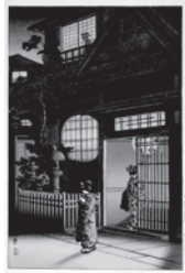
土屋光逸「四ツ谷荒木横町」 山田一旧蔵