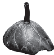
蓮葉花生 市谷加賀町一丁目遺跡出土資料