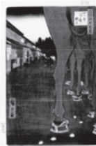
名所江戸百景「四ツ谷内藤新宿」 歌川広重 安政4年(1857)