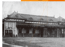
新宿停車場(二代目)