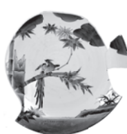
染付竹文巾皿 納戸町遺跡出土資料