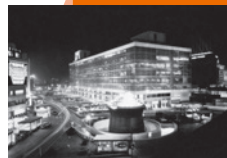
新宿駅東口ステーションビル (四代目)