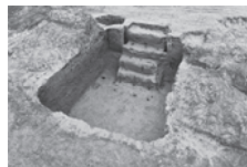
060号遺構 市谷加賀町一丁目遺跡

区内では建物の開発に伴い埋蔵文化財の発掘調査が行われ、発掘調査報告書として記録・保存が行われています。近年、発掘された遺跡や出土品を中心に新宿の歴史を紹介します。