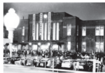
新宿駅国鉄線駅舎(三代目) 昭和35年(1960)