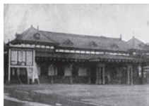
新宿停車場(二代目) 明治44年(1911)

明治18年(1885)日本鉄道の小さな一停車場であった新宿駅。140年後の現在、世界最大級のターミナル駅へと変貌を遂げました。その歴史を紐解きながら、未来の新宿駅も併せて紹介します。