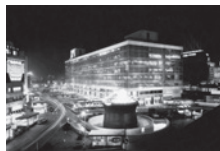
新宿駅東口ステーションビル(四代目) 昭和39年(1964)頃