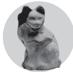
丸メ猫 水野原遺跡出土資料