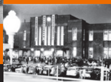
新宿駅国鉄線駅舎(三代目)