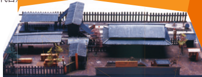
初代新宿駅舎模型