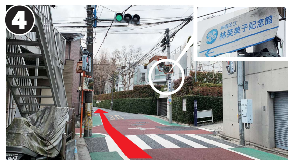
4 信号がある交差点を通過し、まっすぐ進みます。