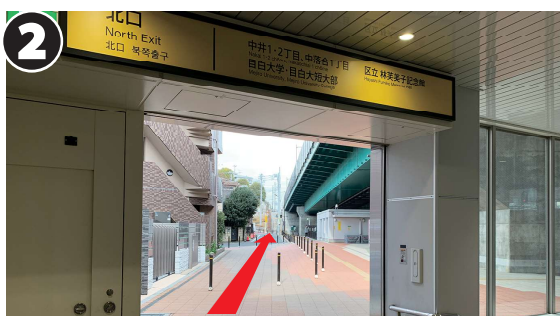
2 エスカレーター（または階段）を上って地上に出たら、陸橋の脇をまっすぐ進みます。