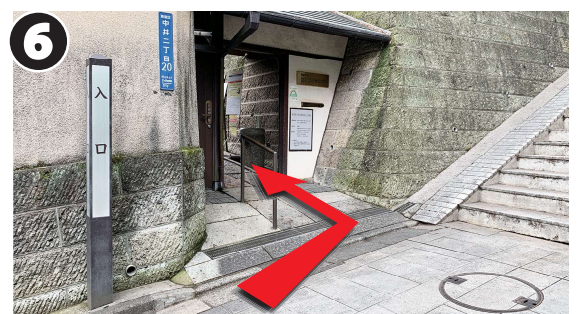
6 「四の坂」の階段下、左手に林芙美子記念館の入口があります。