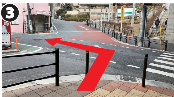
3 横断歩道がある交差点を左折します。