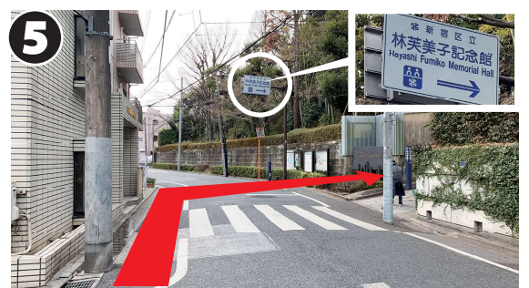
5 記念館の案内板があるところで右折し、「四の坂」に向かいます。