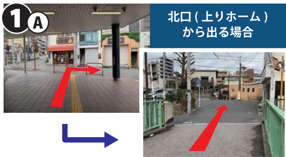
1A 北口(上りホーム)から出る場合

北口(上りホーム)改札口を出て右手に進みます。橋を渡った先を左折し、「下落合駅前交差点」に向かいます。