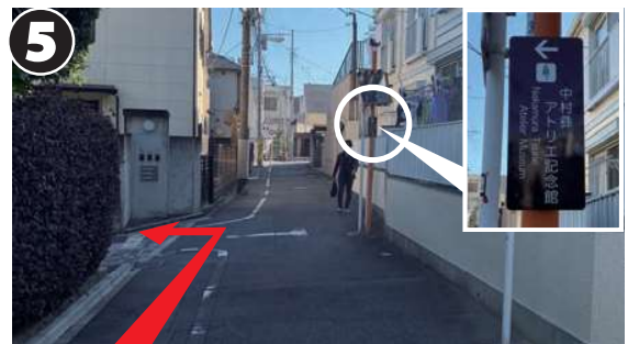
まっすぐ約 200m 進んだら、ミラー柱にある記念館の案内板を目印に、路地を左折します。