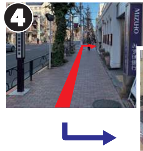
約500m進み、銀行の看板の先にある路地を右折します。スーパーの手前に記念館の案内標があります。