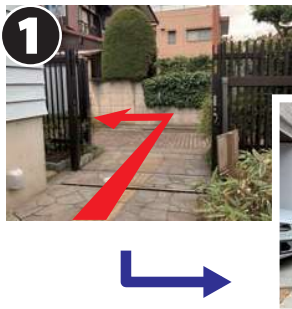
佐伯祐三アトリエ記念館がある佐伯公園を出て、左手に進みます。石畳の突き当りを右折します。