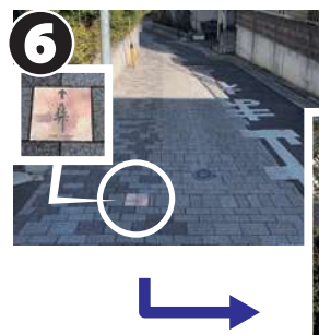
路地の石畳にも案内表示があります。しばらくまっすぐ進むと、左手に「中村彝アトリエ記念館」があります。