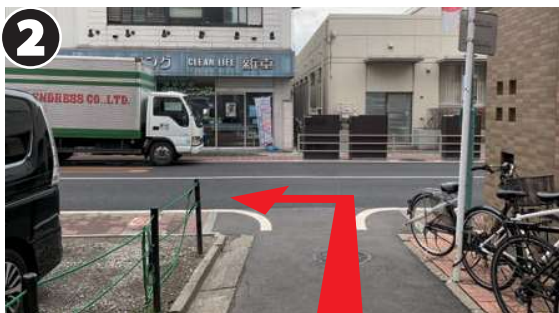
路地を出たら左折し、目白通りまでまっすぐ進みます。