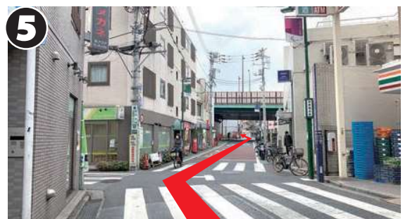
中井通りをしばらくまっすぐ進み、商店街を越えた先の陸橋をくぐり、そのまま道なり(左前)に進みます。