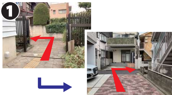
佐伯祐三アトリエ記念館がある佐伯公園を出て、左手に進みます。石畳の突き当りを右折します。