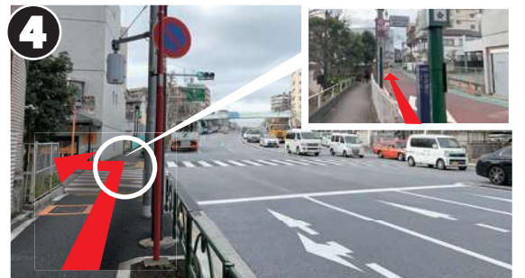
新目白通り沿いをまっすぐ進み、最初の信号機がある三叉路を左折し、中井通りに入ります。