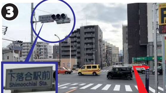
聖母坂通りを進み、信号機がある「下落合駅前交差点」の横断歩道を渡ったら、右折します。