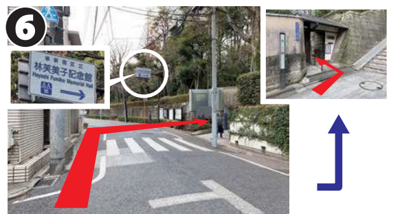
信号がある交差点を越え、案内板があるところで右折すると、左手に林芙美子記念館があります。