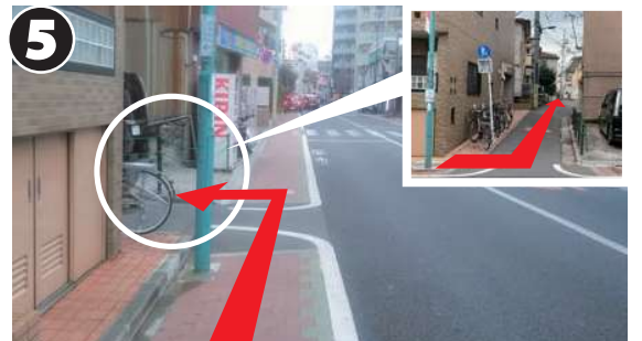
案内板の少し先にある左手の細い路地（酒屋さんの手前）に入ります。