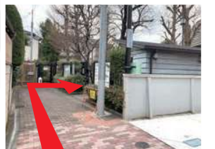
路地に入り約 60m 先にある左の脇道に入ります。石畳の奥の佐伯公園内に佐伯祐三アトリエ記念館があります。