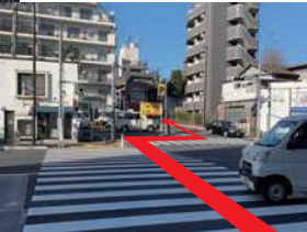
新目白通りを進み、「下落合駅前交差点」を左折します。横断歩道を渡り、聖母坂通りを進みます。