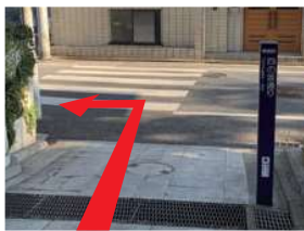
林芙美子記念館の入口を右に出て、四の坂を下ったら、中井通りを左折します。