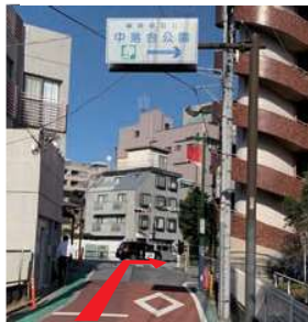
中井通りを約 700m まっすぐ進み、中落合公園の先の新目白通りを右折します。