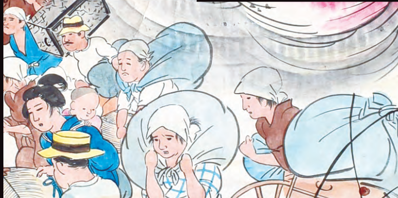
牛込在郷軍人会大震災記念ポスター