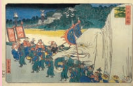
江戸名所 山王まつり 歌川重宣(二代広重) 安政5年(1858)

昔からある風習や年中行事には、豊かな暮らしや子どもの成長などを願う、人々のさまざまな祈りがこめられています。風習や行事の形式は時代に合わせて変化をしてきましたが、そこにこめられた人々の願いや祈りは、昔も今も変わらぬものです。本展では、所蔵資料や写真、古くから新宿に暮らす方々の回想などをたよりに、百年、あるいは二百年以上前から伝えられてきた行事や風習をまとめ、歳時記として紹介します。